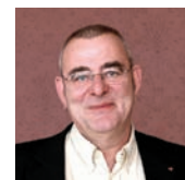
Ulrich Wilken, rechtspolitischer Sprecher DIE LINKE. im Hessischen Landtag