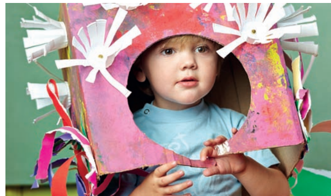
Jedes Kind soll einen kostenfreien, öffentlichen Kitaplatz bekommen.