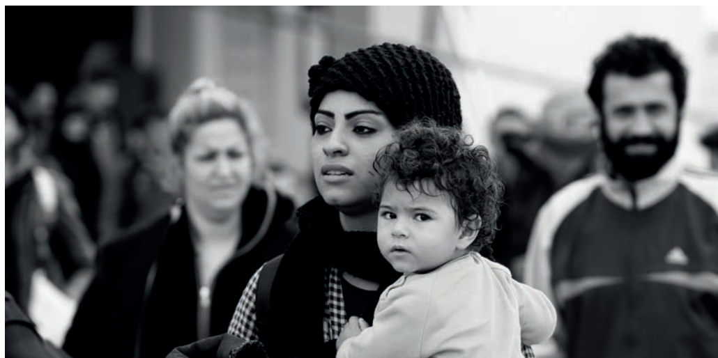
Am Hafen von Piräus, Athen: 2.500 Flüchtlinge aus Syrien, Afghanistan und dem Irak kommen auf dem Festland an, nachdem sie das Meer von der Ostküste der Türkei aus überquert haben.