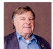
Willi van Ooyen, Fraktionsvorsitzender DIE LINKE. im Hessischen Landtag

Nur wenn der Rüstungsexport gestoppt wird, besteht Grund zur Hoffnung, dass nicht immer mehr Menschen vor den aktuellen und zukünftigen Kriegen aus ihrer Heimat fliehen müssen.