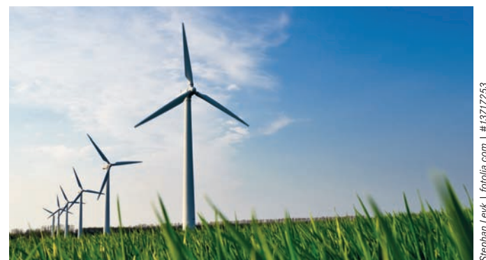
Kommunen, Bürgerinnen und Bürger am Ausbau der Windkraftenergie beteiligen. Standorte fair verteilen und Klima schützen.

Seit dem hessischen Energiegipfel 2011 wirbt DIE LINKE dafür, die Entwicklung der Windkraft in Hessen in die Hände der Bürgerinnen und Bürger sowie der Kommunen zu legen. Und wenn Energiekonzerne die Windräder betreiben, müssen die betroffenen Kommunen zumindest angemessen beteiligt werden.